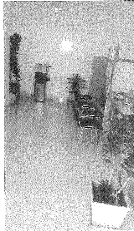
Se realizó el guiado de los tallos para mejor vista ornamental