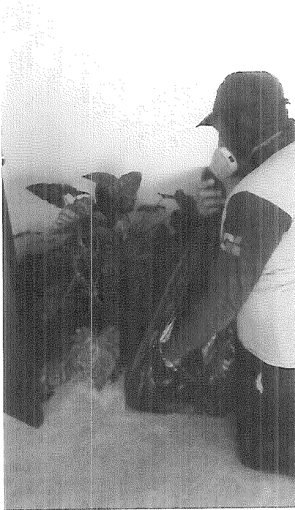
Se realiza la poda formativa de las plantas, nótese la mascarilla normada