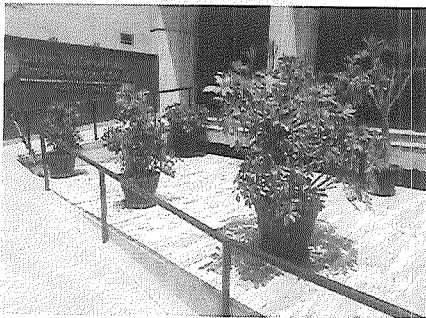
Se realiza labores lavado de hojas, limpieza de hojas y poda formativa.