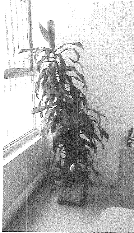
Lavado de hojas y limpieza de hojas