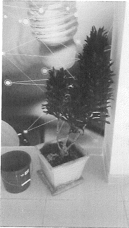
Lavado de hojas y podas