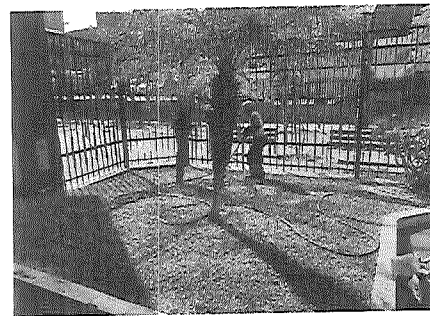
Mantenimiento general de áreas verdes