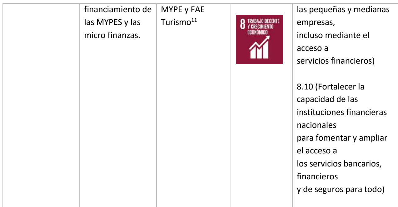
Tabla. Asignación de Fondos