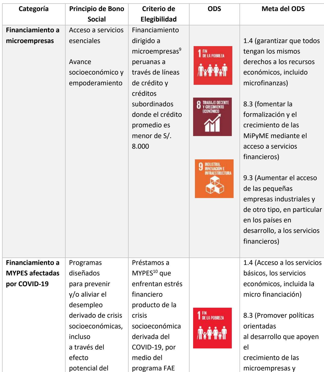
Tabla. Cuadro de categorías de proyectos sociales elegibles

No existe saldo neto de fondos no asignados.