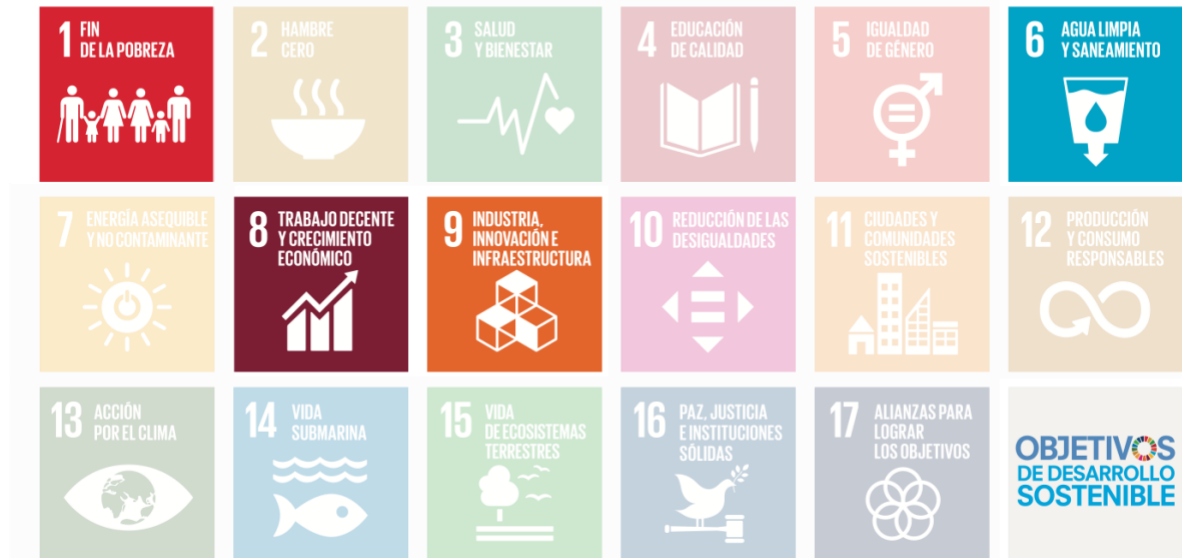
Figura 1. Alineamiento con los ODS 20