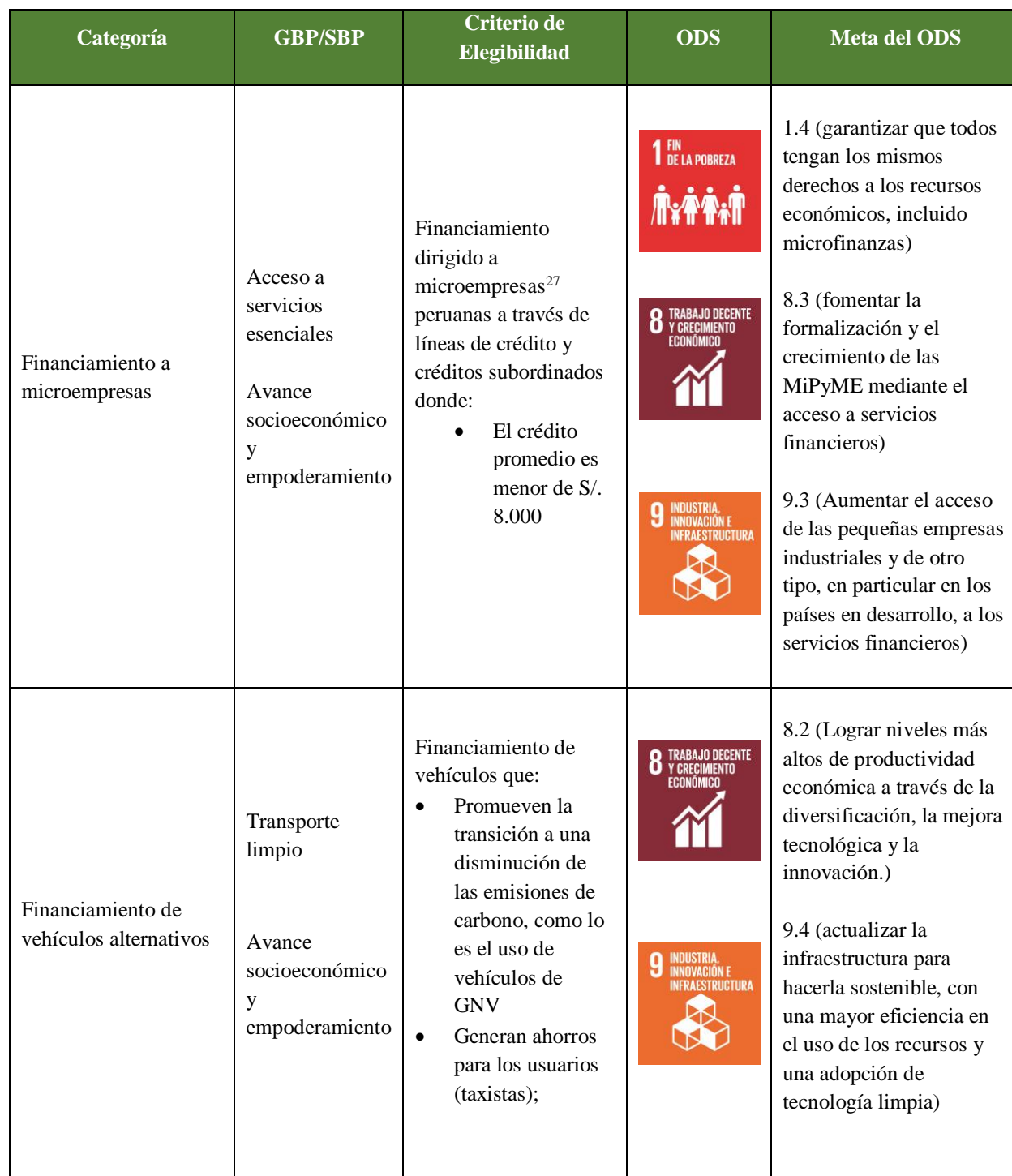
Tabla 1. Categorías de elegibilidad 26